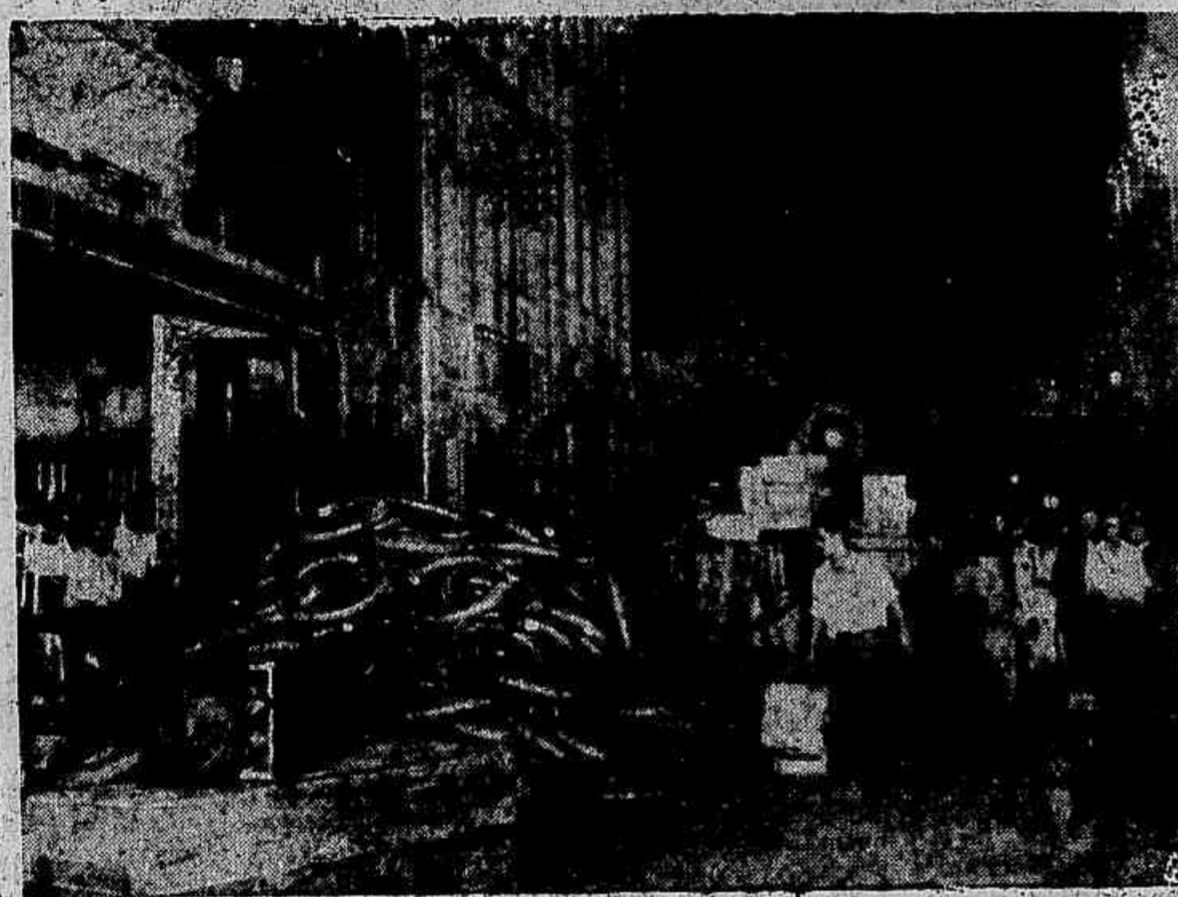
Parte do "stock" de pneumaticos da Companhia Firestone, salvo pelos bombeiros

(Conclusão da 1ª pagina) lambendo a escada e ameaçando cortar a retirada dos bombeiros. Houve um toque precipitado de retirada. O commandante do serviço não queria sacrificar inutilmente a vida dos seus homens. Desceram dois. Mas o terceiro ficou lá em cima, como se estivesse ofuscado pelas chamas ou entontecido pelo fumo. Um arrippe fez estremecer de emoção a onda de curiosos que se espraivava ao longo do Passeio Publico.